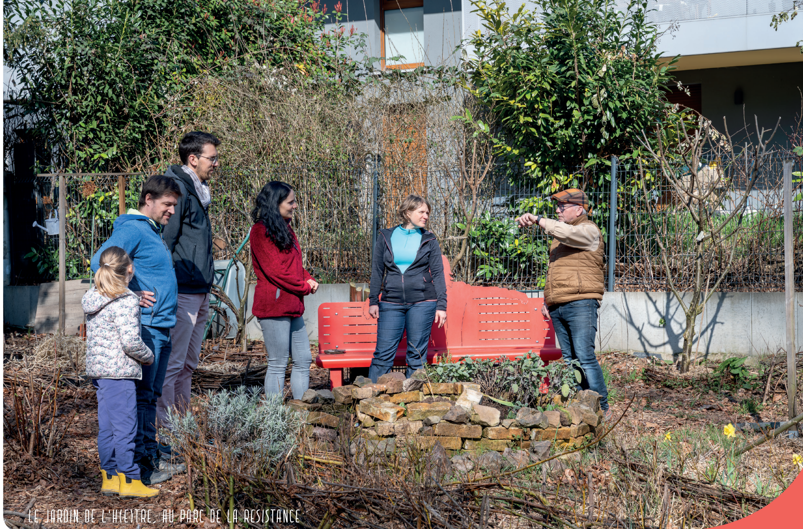
LE JARDIN DE L'HÊTRE, AU PARC DE LA RÉSISTANCE