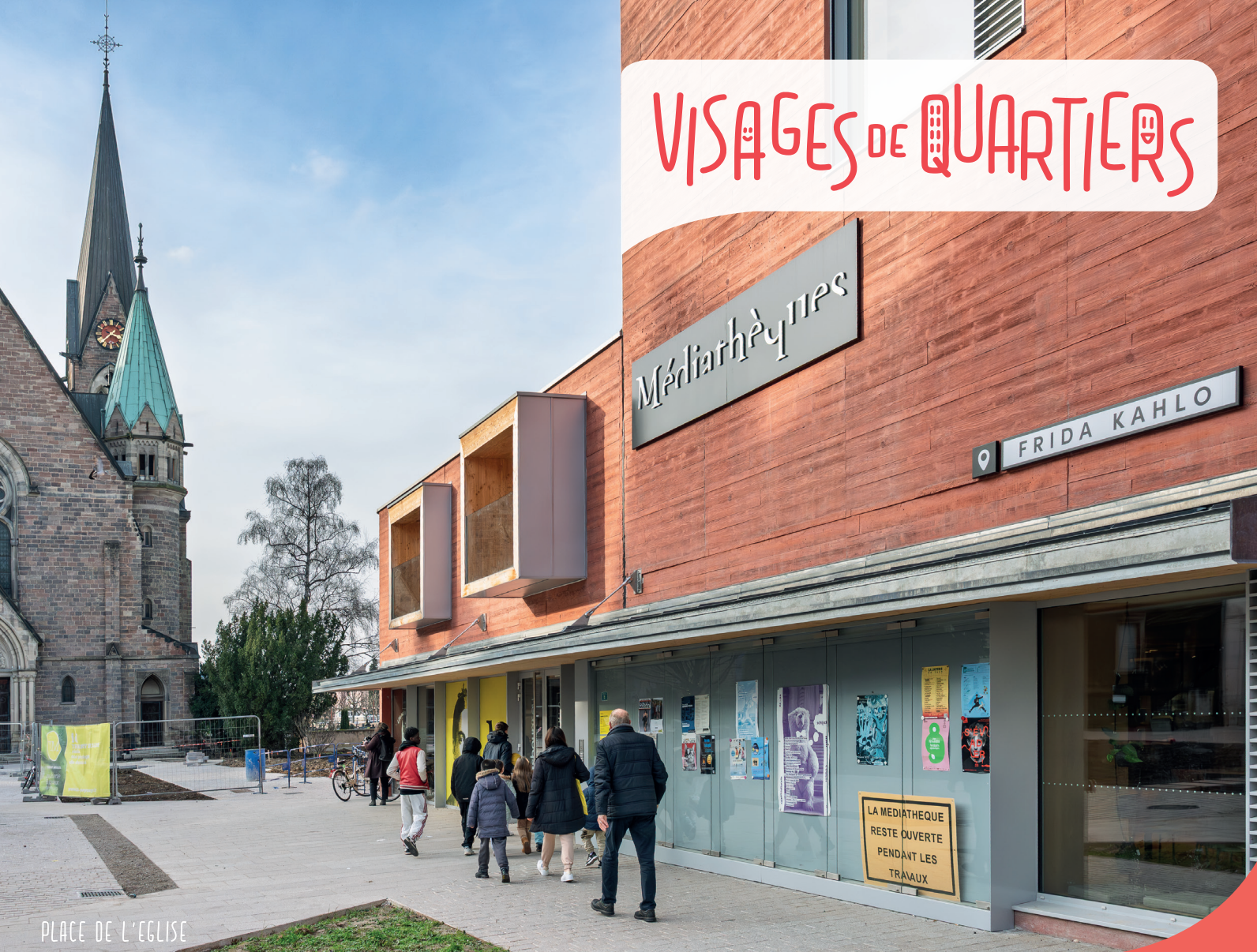
PLACE DE L'EGLISE